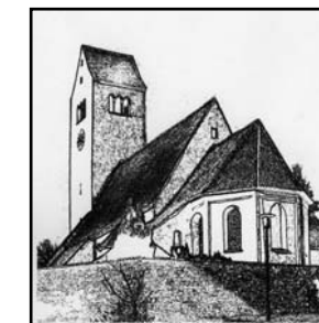
ST. PETER UND PAUL HOPFEN