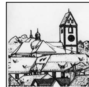
ST. MANG FÜSSEN