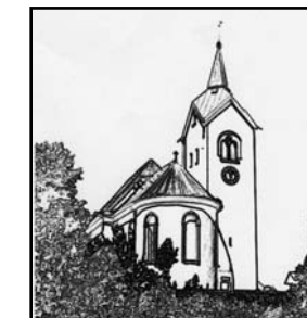
ST. WALBURGA PHILIPP. UND JAKOBUS WEIBENSEE